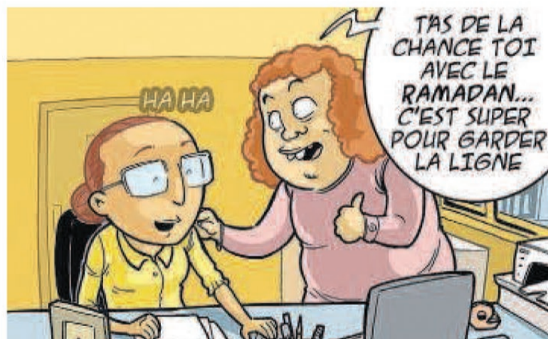
La BD séduit également de plus en plus les non-musulmans.

La seconde BD, intitulée « ADABéo », clin d'œil au mot arabe adab , utilisé pour caractériser le comportement que le musulman doit avoir envers Mahomet, se lit gratuitement sur le site Internet AL-