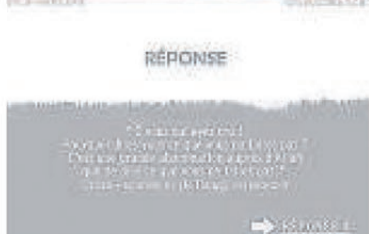
La bande dessinée « ADABéo », diffusée exclusivement sur Internet, propose chaque jour un quiz pour aider les pratiquants à vivre l'islam au quotidien.